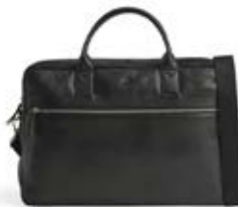
VINCENT 14" LAPTOP BAG ANB. B2B PRIS DKK EX. MOMS 560,-