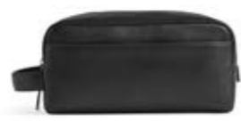
DOMINIC TOILETRY BAG ANB. B2B PRIS DKK EX. MOMS 250,-