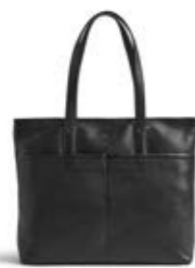
MOLINA SHOPPER ANB. B2B PRIS DKK EX. MOMS 400,-