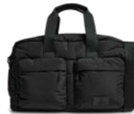
MORE WEEKEND BAG ANB. B2B PRIS DKK EX. MOMS 400,-