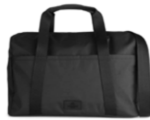
INDY WEEKEND BAG ANB. B2B PRIS DKK EX. MOMS 300,-