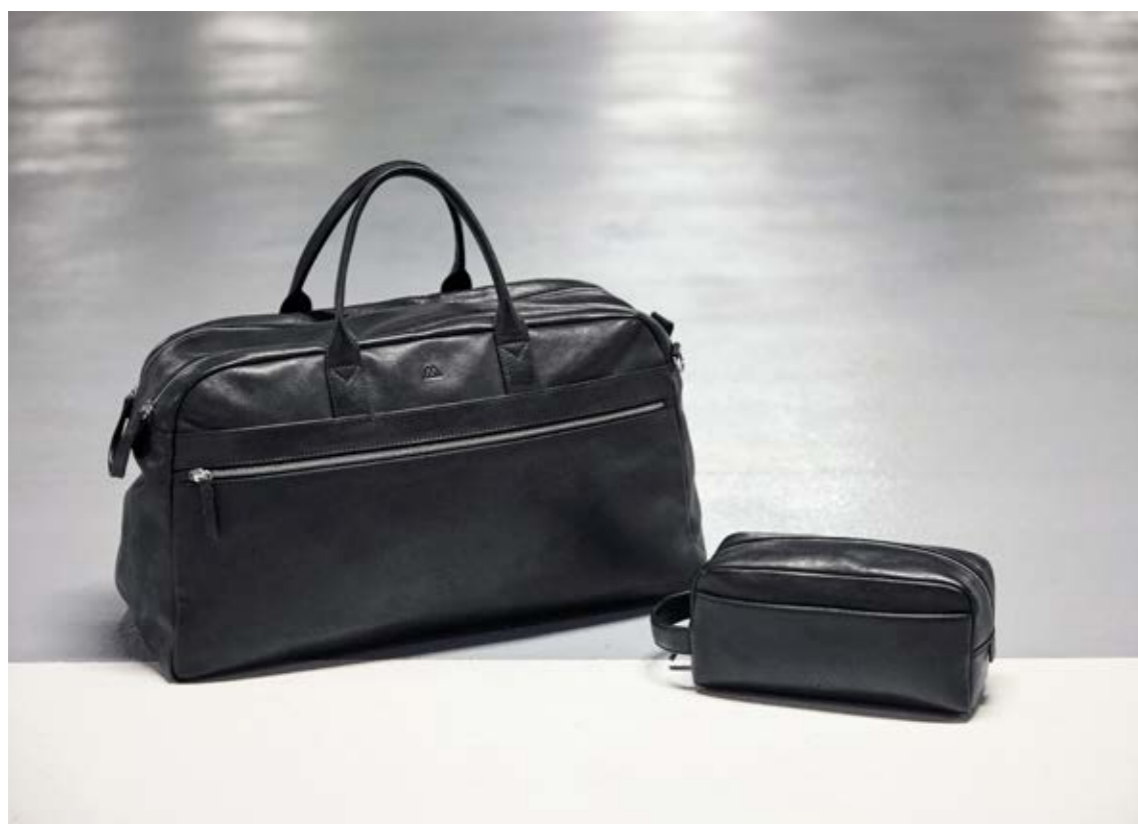
THEODORE XL WEEKEND BAG + DOMINIC TOILETRY BAG