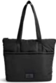
PERRY SHOPPER ANB. B2B PRIS DKK EX. MOMS 300,-