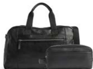
WESLEY WEEKEND BAG + DOMINIC TOILETRY BAG ANB. B2B PRIS DKK EX. MOMS 800,-