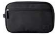
SIMON TOILETRY BAG ANB. B2B PRIS DKK EX. MOMS 200,-