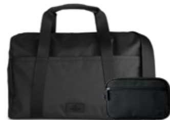
INDY WEEKEND BAG + SIMON TOILETRY BAG ANB. B2B PRIS DKK EX. MOMS 400,-