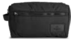
JOSEPHINE TOILETRY BAG ANB. B2B PRIS DKK EX. MOMS 250,-