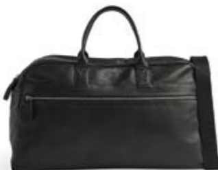
THEODORE WEEKEND BAG ANB. B2B PRIS DKK EX. MOMS 800,-