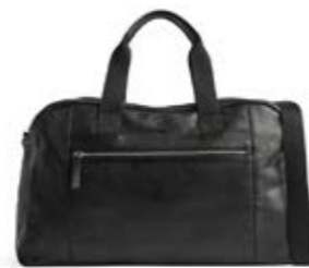
WESLEY WEEKEND BAG ANB. B2B PRIS DKK EX. MOMS 640,-