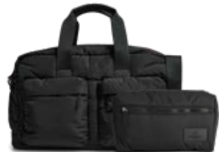
MORE WEEKEND BAG + JOSEPHINE TOILETRY BAG ANB. B2B PRIS DKK EX. MOMS 560,-