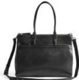
JUNIPER BAG ANB. B2B PRIS DKK EX. MOMS 640,-