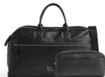
THEODORE WEEKEND BAG + DOMINIC TOILETRY BAG ANB. B2B PRIS DKK EX. MOMS 960,-