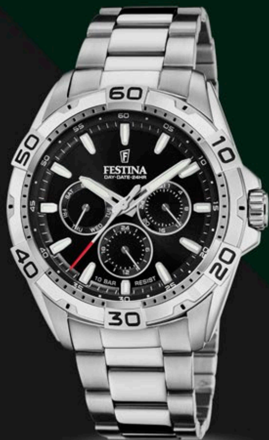
F20623/5 ANB. B2B ERHVERVSPRIS 560,- VEJL. PRIS: 998,-