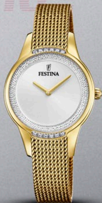
F20495/1 ANB. B2B ERHVERVSPRIS 640,- VEJL. PRIS: 1.198,-