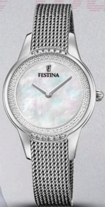
F20494/4 ANB. B2B ERHVERVSPRIS 560,- VEJL. PRIS: 998,-