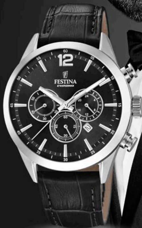
F20542/5 ANB. B2B ERHVERVSPRIS 640,- VEJL. PRIS: 1.498,-