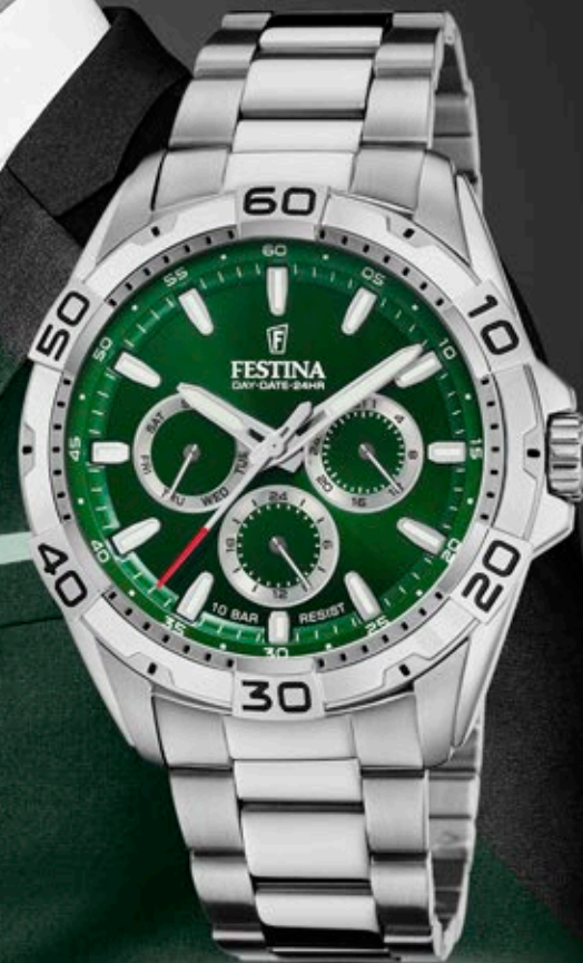
F20623/3 ANB. B2B ERHVERVSPRIS 560,- VEJL. PRIS: 998,-