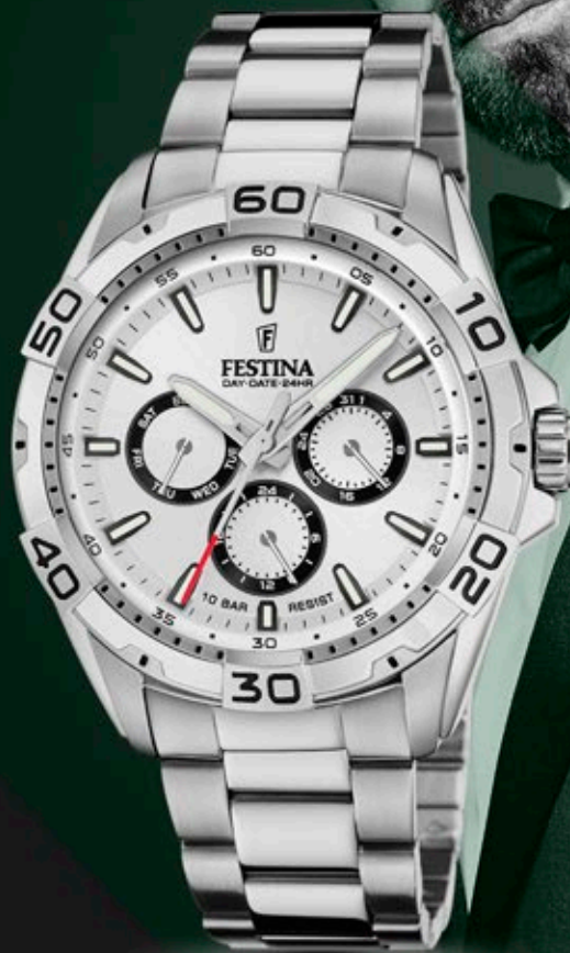
F20623/1 ANB. B2B ERHVERVSPRIS 560,- VEJL. PRIS: 998,-