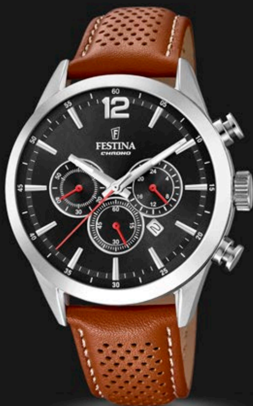
F20542/6 ANB. B2B ERHVERVSPRIS 640,- VEJL. PRIS: 1.498,-