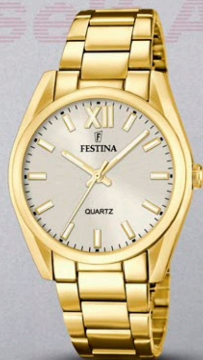
F20640/1 ANB. B2B ERHVERVSPRIS 640,- VEJL. PRIS: 1.198,-