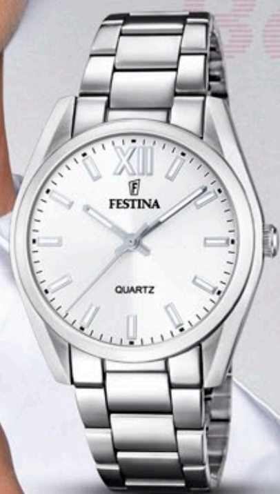
F20622/1 ANB. B2B ERHVERVSPRIS 560,- VEJL. PRIS: 998,-

Be Yourself And.. Be Yourself And.. Be Yourself And.. Be Yourself And..