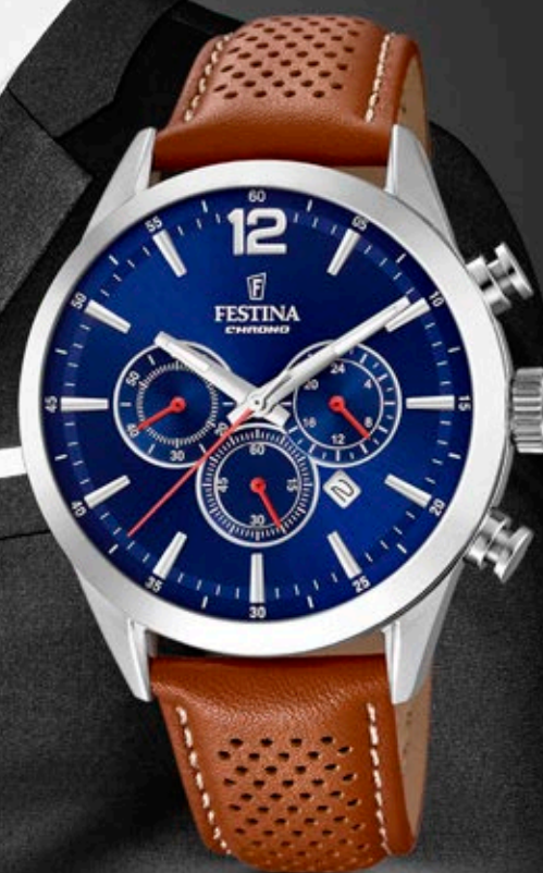
F20542/3 ANB. B2B ERHVERVSPRIS 640,- VEJL. PRIS: 1.498,-